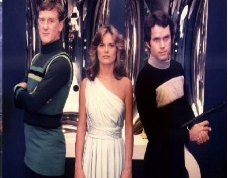
LE SOUS-PULL AVEC DES BANDES (OU PAS)